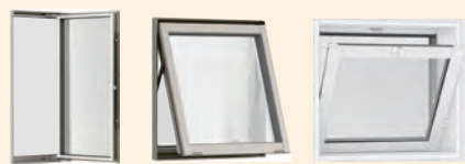
縦すべり出し窓 グレモン