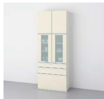
カップボード 二方框 シースルー扉タイプ (奥行45cm系) ○写真は間口90cmです。