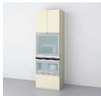
家電タワー (奥行65cm系)