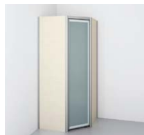
コーナークローゼット ○写真は間口105×105cmです。