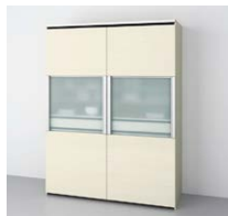
2ウェイクローゼット (奥行45・65cm系) ○写真は間口180cmです。