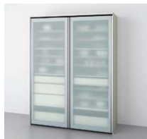
フラットスライド クローゼット (奥行45・65cm系) ○写真は間口180cm・奥行65cm系です。