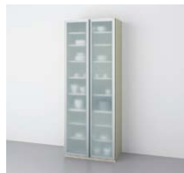
シンプルストッカー (奥行45・65cm系) ○写真は間口75cm・奥行45cm系です。