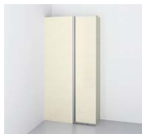
コーナーストッカー