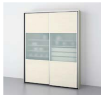
スライディング ドアストッカー (奥行45cm系) ○写真は間口180cmです。