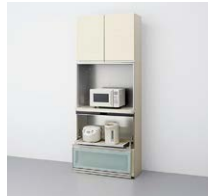
家電タワー (奥行45cm系)