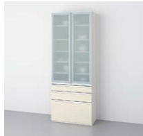
カップボードシンプルタイプ (奥行45cm系) ○写真は間口90cmです。