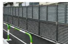
2段施工 上段:RA型/下段:RB型

目隠し機能のオブリークフェンスは、パネルのタイプが通風、採光、目隠しなど5種類。2段施工では異なるパネルの組み合わせも可能です。規格品で傾斜地にも対応します(RE型は特注対応)。