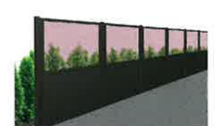
MB-1N型 遮音タイプ+採光タイプ(透明)