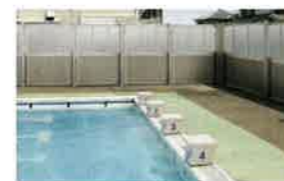
2段施工 上段:RE型/下段:RD型