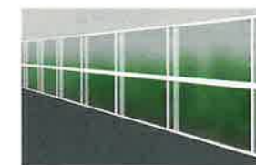
MB-2型 採光タイプ(すりガラス調)

目隠し機能に加え、防音機能により日々の騒音までも低減して快適な環境を提供する、防音性・施工性・意匠性を追求した防音めかくしフェンス。