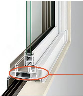
アルミと樹脂の熱伝導率イメージ

高性能樹脂窓「EW」をベースに開発。枠の効果的な位置に断熱材をいれることで、ペアガラスでも補助金断熱性能Sグレードに対応