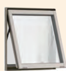
横すべり出し窓 グレモン