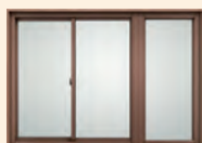
連窓(引違い窓ーFIX窓)

※既設方立残して対応可 ※引違い窓ーFIX窓、FIX窓ーFIX窓(いずれも非防火)のみ