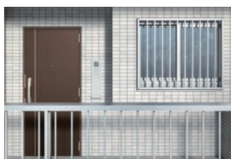
防火戸 居室仕様 引違い窓